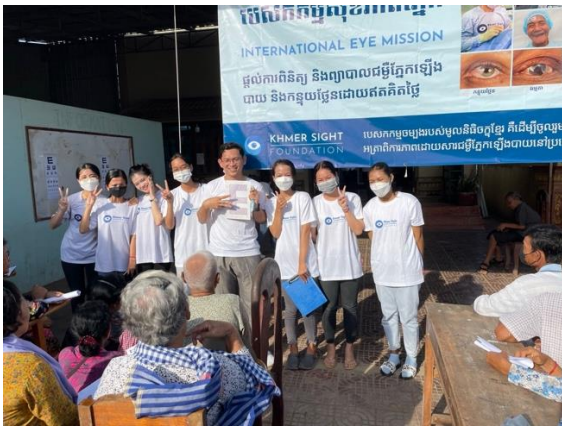
Einige der 11 Kidshelp-Freiwilligen, die das KSF-Team unterstützen.