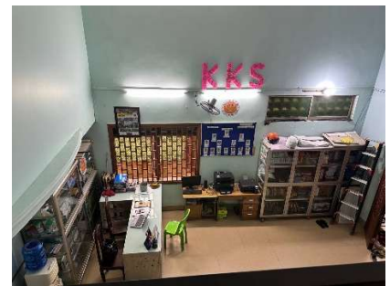
Neuer Eingangsbereich der Khemara Kidshelp School