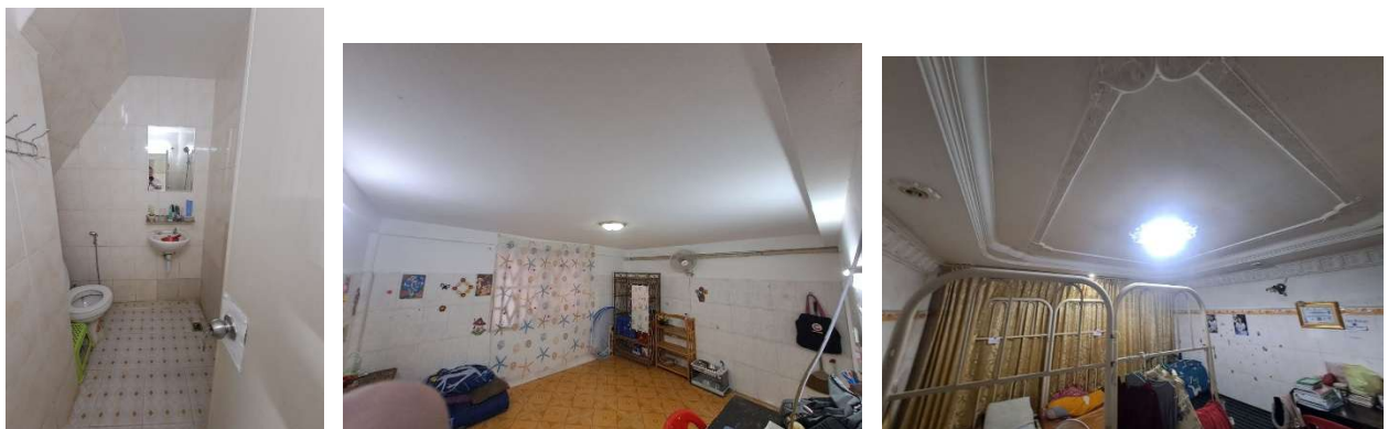
Renoviertes Bad und renovierte Räume im Studentinnen-Wohnheim

Das Treffen mit den Alumni und die Studierenden-Party im Wohnheim boten Gelegenheit, alle derzeitigen Studierenden kennenzulernen und sich über die Fortschritte unserer Alumni-Gruppe zu informieren. Seit der Studierenden-Party im Wohnheim freuen wir uns auch, dass alle Schlafzimmer, Badezimmer und Küchen inspiziert und bei Bedarf renoviert wurden.