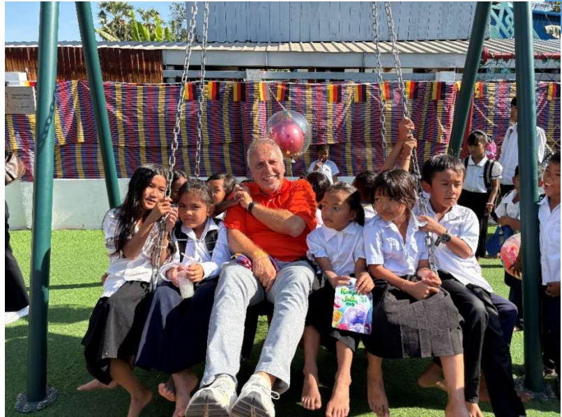
Einweihung der Schaukel, die von den Kindern der Nachbarschaft und Schule sehr stark genutzt wird

Wir danken allen Sponsoren, die dieses Projekt erst möglich gemacht haben. Die Kinder in Kambodscha werden von dieser Schule genauso profitieren, wie viele vor ihnen bereits von der KKS, die seit Ende 2010 in Betrieb ist, profitieren durften – sei es, dass ihre Englischkenntnisse ausreichten, um einen besseren Job oder sogar einen Studienplatz zu erhalten.