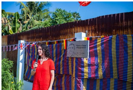
Feierliche Enthüllung des Schildes