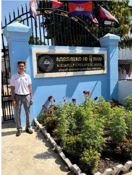
Eingangstor zur neuen Englischschule

Ein Herzensprojekt in diesem Jahr ist die Einweihung der neuen Englischschule in Roka Kaong, die den Namen Kidshelp English School (KES) trägt.