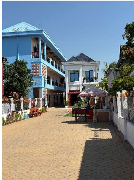
Neue Englischschule - KES

Nach der Ground Breaking Ceremony am 13. September 2024 begann der Bau, und bereits am 27. Mai 2025 konnte das Gebäude übergeben werden. Die vertraglich vereinbarten Meilensteine wurden eingehalten, einzelne Bauabschnitte sogar früher als geplant fertiggestellt.